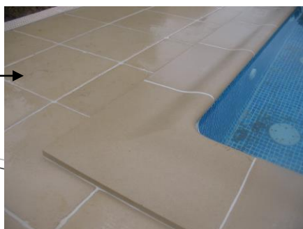
Galbées 26,5 Sable Dune