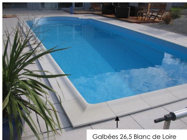
Galbées 26,5 Blanc de Loire