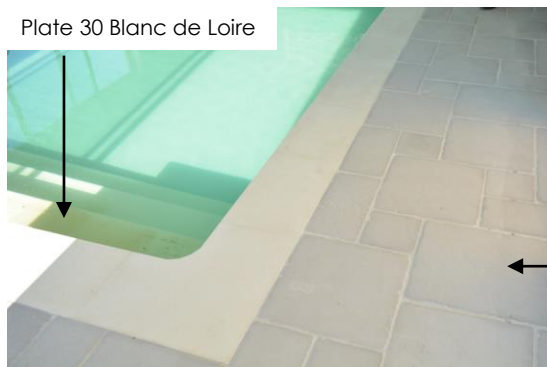
Plate 30 Blanc de Loire