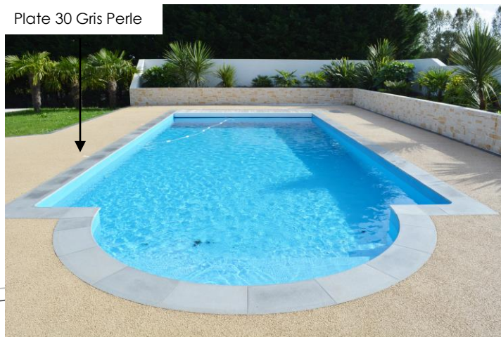
Plate 30 Gris Perle